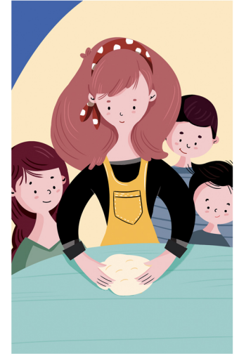
MAMMA E BAMBINI